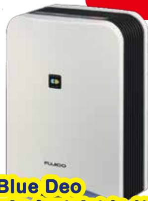
Blue Deo 空気清浄機