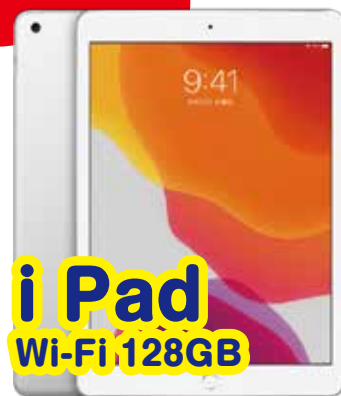
i Pad Wi-Fi 128GB